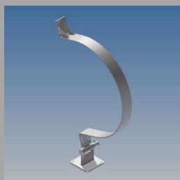
Figura 2: Trava superior