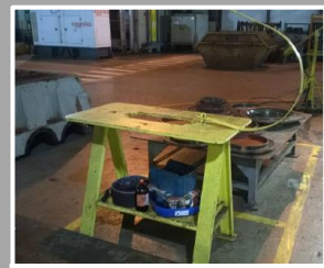
Exemplo de bancada comum (rodas truck)