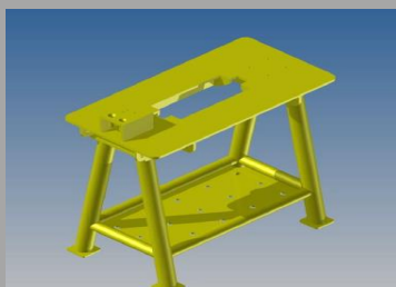
Figura 2: Bancada