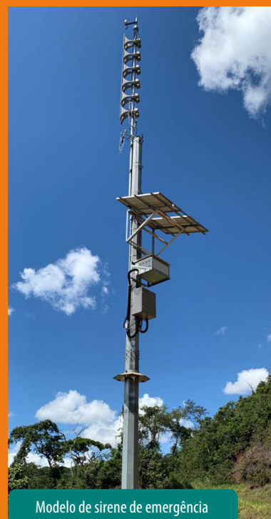
Modelo de sirene de emergência

O primeiro teste das sirenes da barragem Mosquito, Dição Leste e Dique Paracatu foi realizado na segunda quinzena de abril e depois seguirá uma programação mensal. Todas as ações serão informadas previamente à comunidade pela Vale e a Defesa Civil de Catas Altas. As atividades são preventivas. Assim, ao ouvir o som das sirenes, não é necessário se deslocar de onde você estiver.