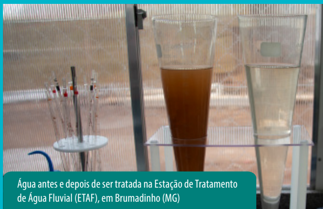
Água antes e depois de ser tratada na Estação de Tratamento de Água Fluvial (ETAf), em Brumadinho (MG)

“ A Vale está escrevendo um novo capítulo de sua história. Seguimos focados em transformar o futuro por meio do desenvolvimento socioeconômico das regiões onde operamos, gerando um legado positivo.