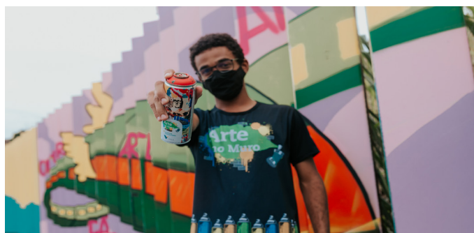
O “Trem do Futuro” foi pintado na Estação da Vale em Itabira

Uma iniciativa da Vale, o Arte no Muro conta com a participação da comunidade e artistas da região na criação de painéis artísticos ao longo do ramal da Estrada de Ferro Vitória a Minas (EFVM). Desta vez, foi a estação ferroviária de Itabira que ganhou novas cores.