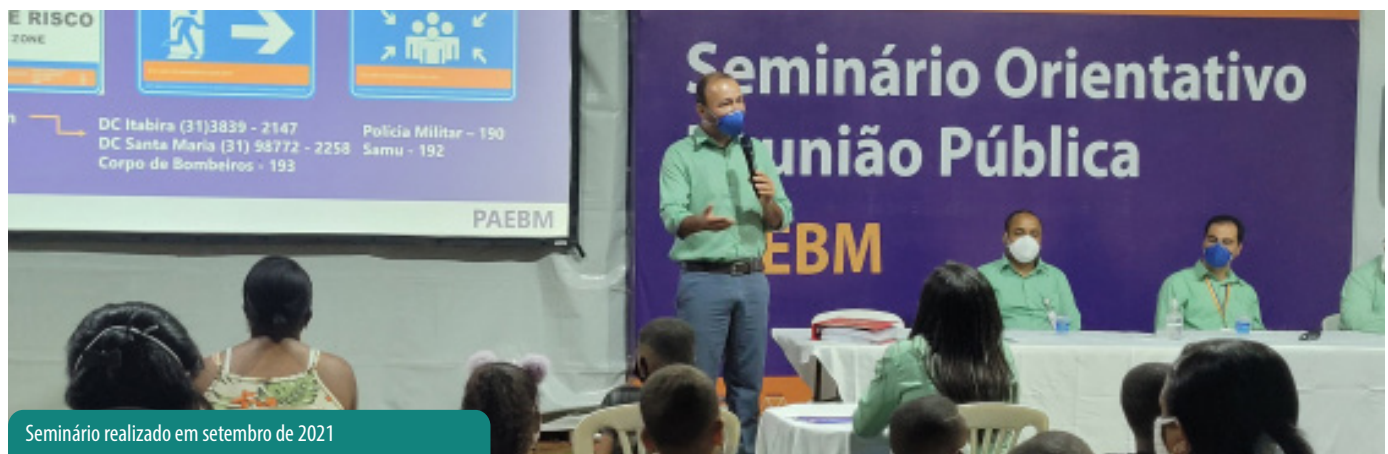
Seminário realizado em setembro de 2021

Os seminários são realizados em formato virtual e presencial, respeitando os protocolos de segurança contra a Covid-19.