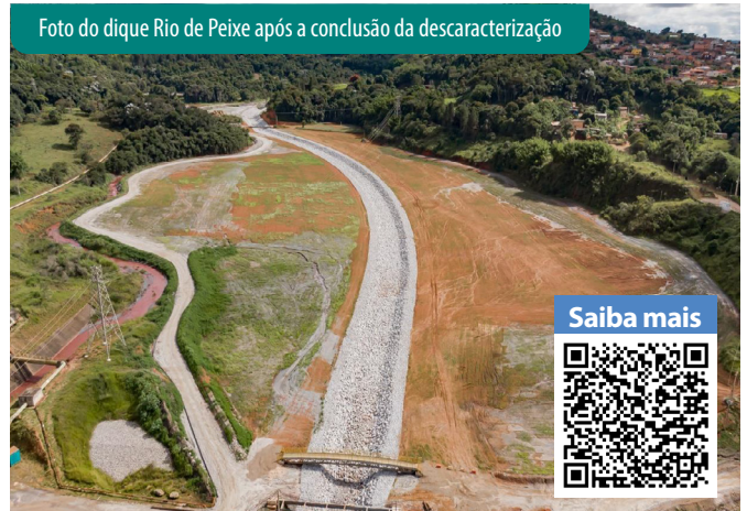
Foto do dique Rio de Peixe após a conclusão da descaracterização

A segunda etapa, ainda em estudo, prevê a descaracterização dos outros diques da Barragem