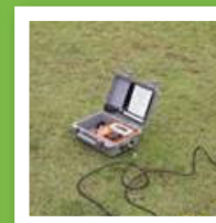
Monitoramento de Vibração