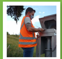
Monitoramento do Ar