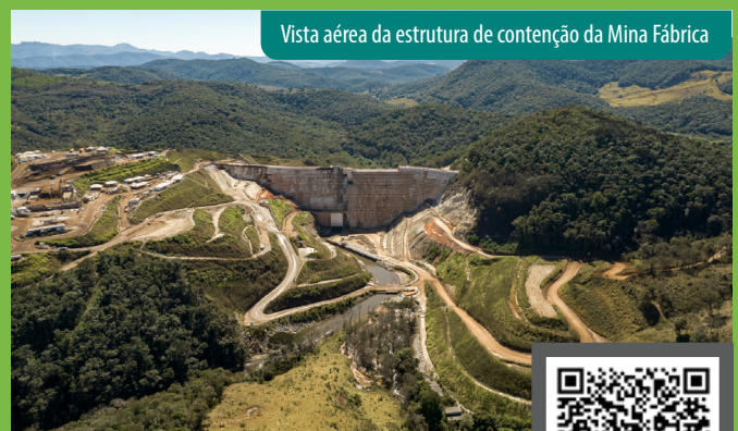
Vista aérea da estrutura de contenção da Mina Fábrica

Com 95 metros de altura e 330 metros de comprimento, o equivalente a um prédio de 32 andares, a estrutura aumenta a segurança das pessoas que vivem em comunidades próximas e protege as Zonas de Segurança Secundária das referidas barragens, que incluem parte dos municípios de Itabirito, Raposos, Rio Acima e Nova Lima. A conclusão da estrutura diminui consideravelmente a circulação de carretas em Itabirito, levando mais tranquilidade à comunidade.