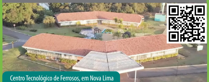
Centro Tecnológico de Ferrosos, em Nova Lima

Aponte seu celular para o QR Code abaixo e confira: