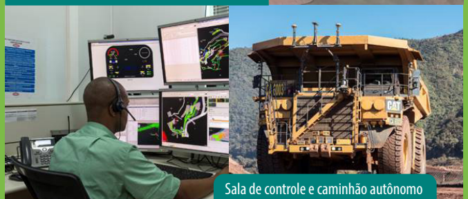
Sala de controle e caminhão autônomo