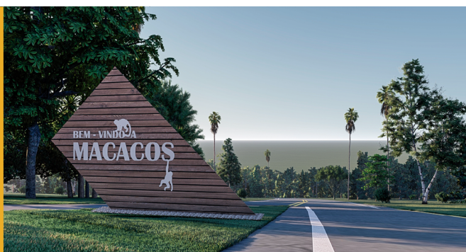
Totem de madeira recebeu 743 votos

Três opções de totem, de materiais diferentes (concreto armado, grade metálica e madeira) disputaram a preferência dos moradores. A opção escolhida foi o modelo abaixo: